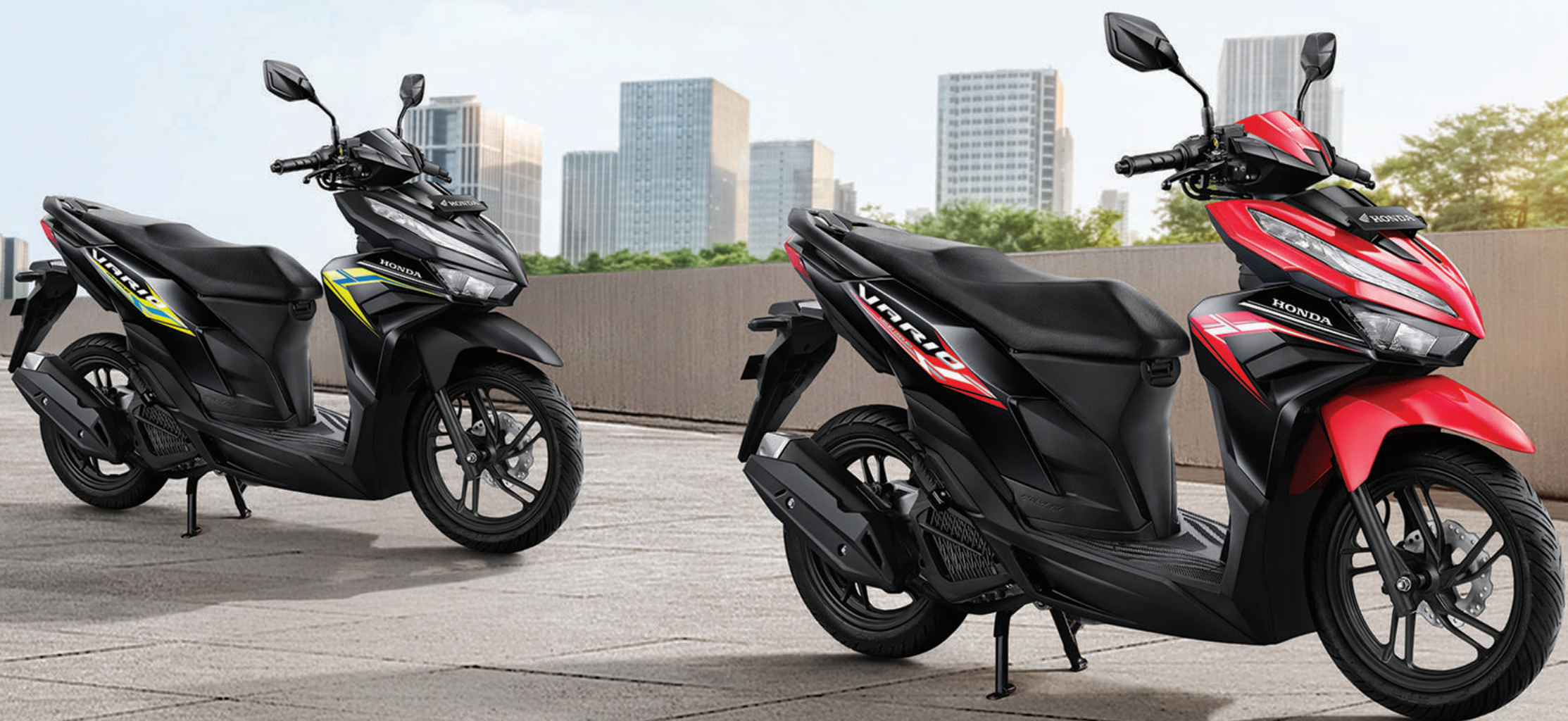
SPORTY MATTE BLACK (Tipe CBS)