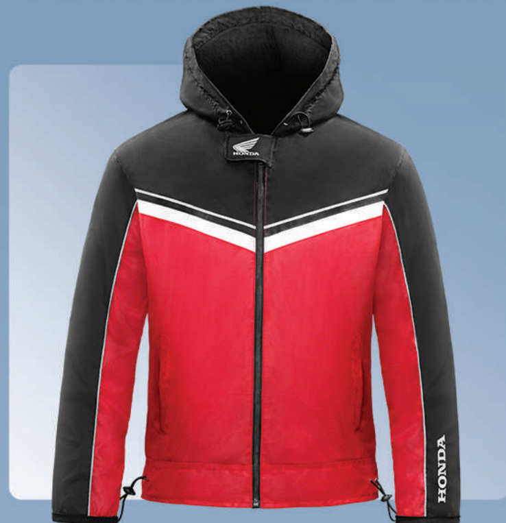
Honda Windbreaker Jacket