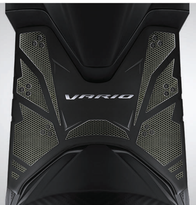
Rubber Step Floor

*Accessories dan Apparel dijual terpisah