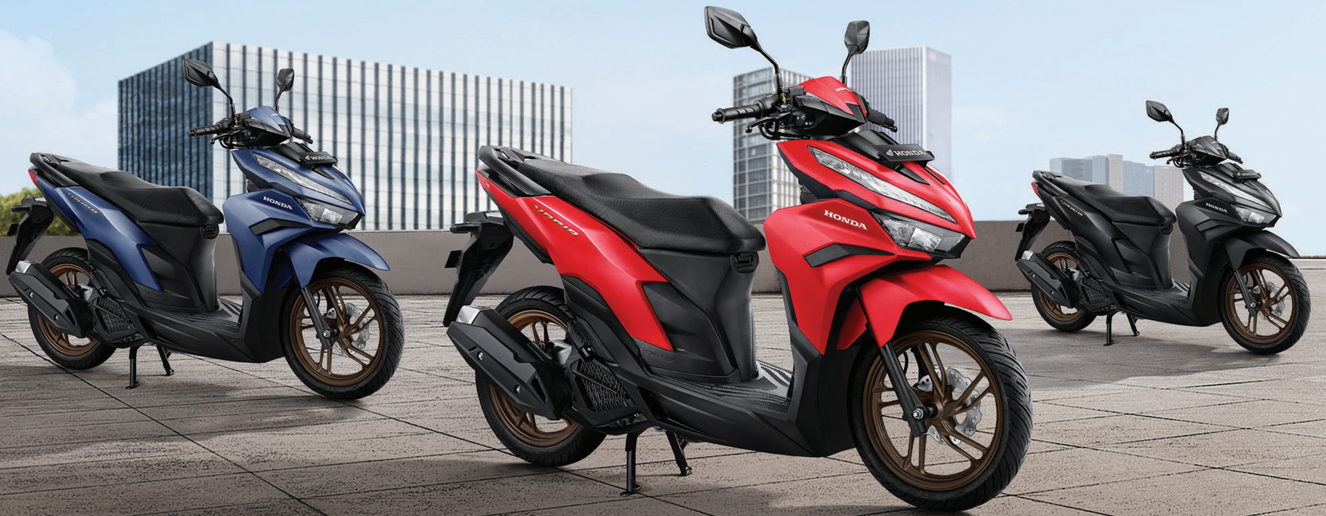
ADVANCE MATTE BLUE (Tipe CBS-ISS)