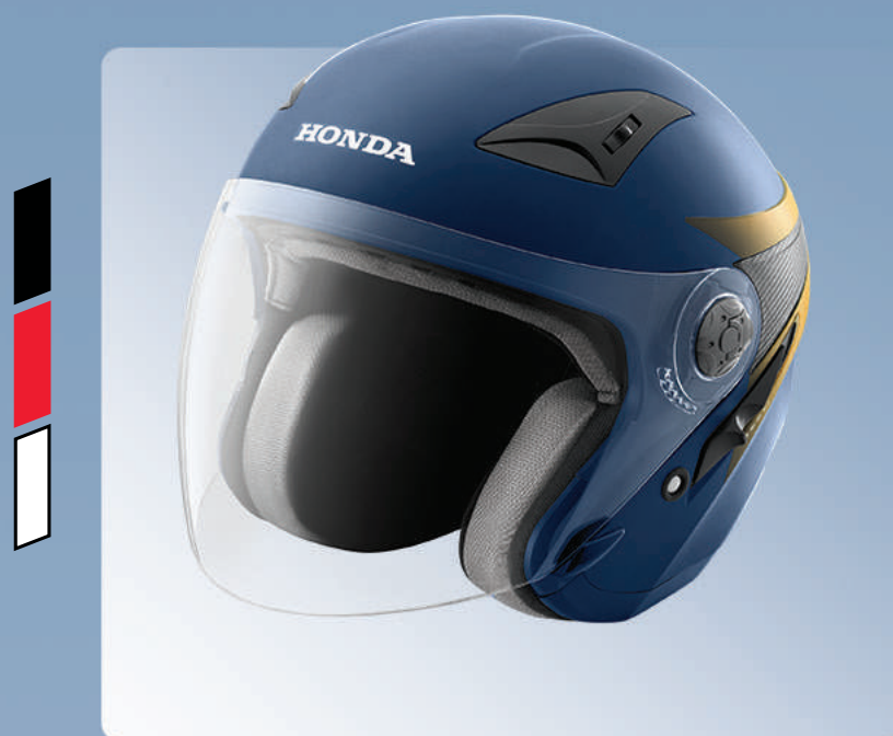
Honda Luxury Helmet