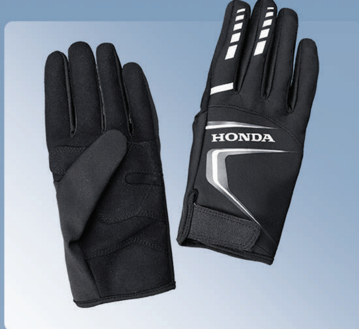
Honda Aquos Gloves