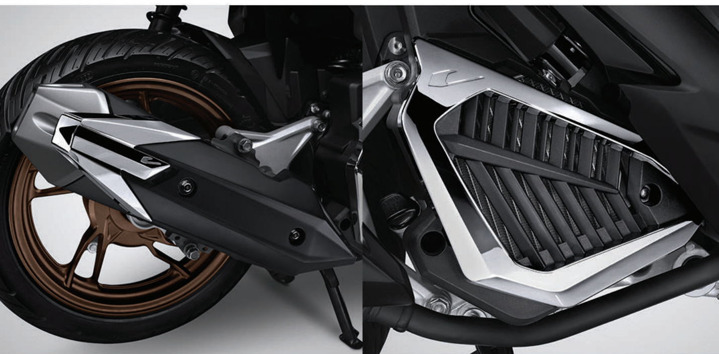
Garnish Cover Muffler