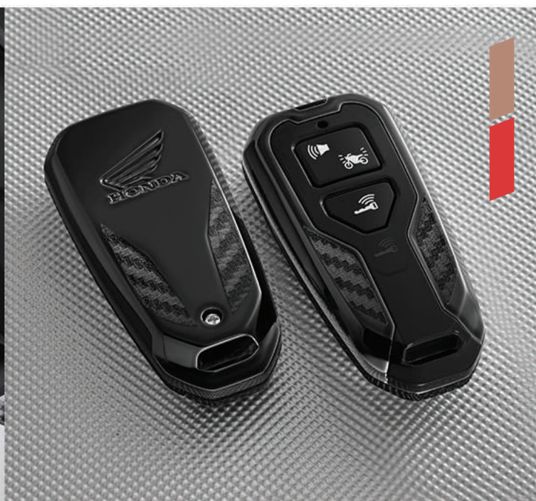
Smart Key Remote Cover